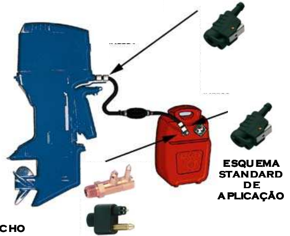
ESQUEMA STANDARD DE APLICAÇÃO